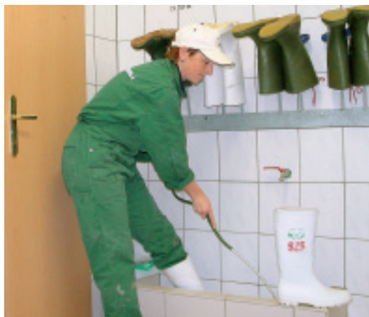
Die regelmäßige Stiefelreinigung nach jedem Stallbesuch ist Grundbestandteil des Biosicherheitskonzeptes.

Für den letzten Schritt im Hygieneprotokoll – der Desinfektion – sind Sauerstoffverbindungen wie VIRKON-S® zu bevorzugen, da sie sowohl für die Stallungen und die Werkzeuge, als auch für die Stiefeldesinfektion in Desinfektionswannen geeignet sind. Jedoch ist für alle Desinfektionsmittel die richtige Konzentration und Ausbringungsmenge laut Anweisung genauestens einzuhalten, da ansonsten völliger Wirkungsverlust eintritt. Im Winter (< 5 °C) sind zur Desinfektion im Außenbereich