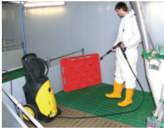
Auch Treibbretter und „Werkzeuge“ des täglichen Gebrauchs müssen nach der Arbeit regelmäßig gereinigt werden.

ruhe von mindestens 3 Tagen ist auch in der kalten Jahreszeit einzuhalten.